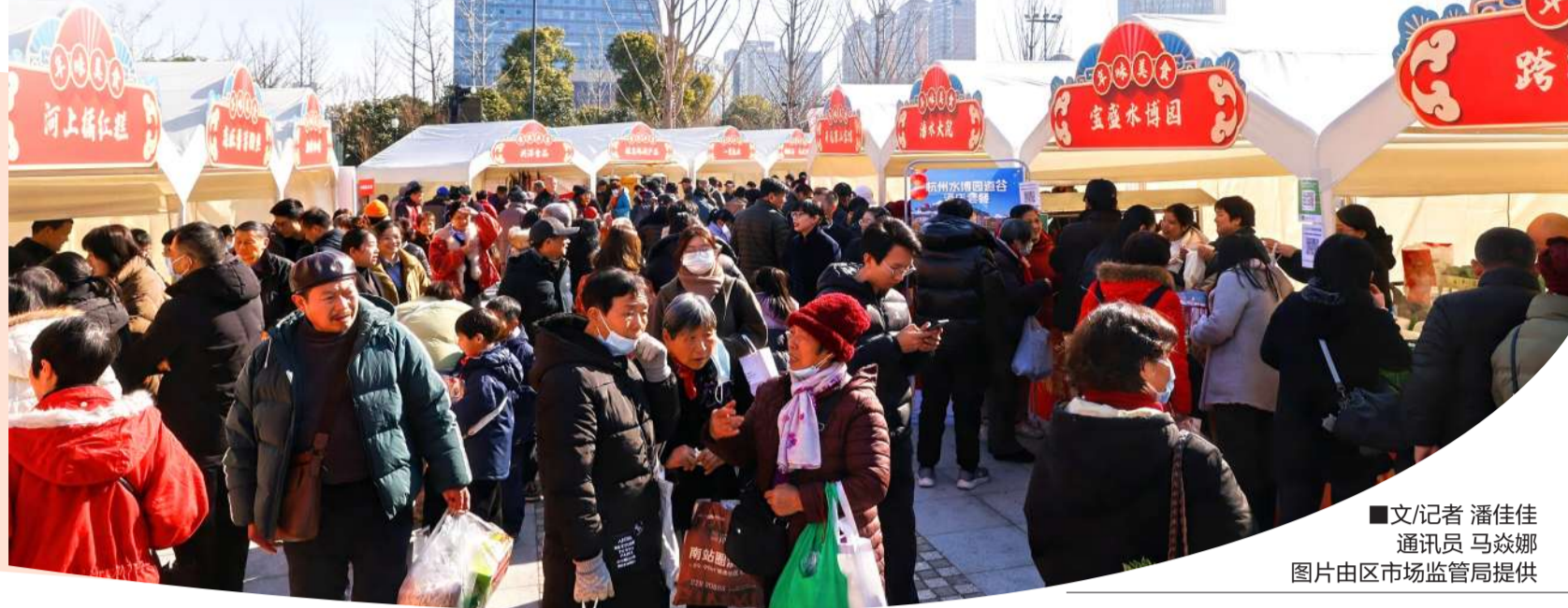
■文/记者 潘佳佳 通讯员 马焱娜

多项知识产权指标持续领跑全省;多个国家级创新项目实现“零的突破”;经营主体总量突破29万,其中企业数突破15万,居全省第二、全市第一;“萧山好市”年货大集带动消费近亿元,惠及百万人次……2025年,萧山区市场监督管理局(简称区市场监管局)在区委区政府的坚强领导下,以“12358”工作体系为引领,深入践行“守正创新、勤廉担当”理念,锚定“八维承市”发展路径,紧扣经济民生部门职能定位,以最优营商环境的创造者、统一大市场的建设者、知识产权强区的引领者、一流质量品牌的培育者、开放标准体系的推动者、高水平安全的守护者、消费者权益的保护者,将市场主体诉求与群众期盼深度融入改革实践,打造了一系列具有市监辨识度的标志性成果,为萧山高质量发展注入了强劲有力的市场监管动能。