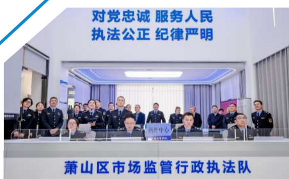
对党忠诚 服务人民 执法公正 纪律严明

在推动经营主体量质齐升的同时,区市场监管局在赋能产业升级方面也精准发力、成效显著。随着全市首个区级药品和医疗器械审评检查服务分中心落地萧山,产业创新生态得到进一步优化;3款医疗器械入选省药监局“研审联动”增值服务改革试点,并成功实现国家级创新医疗器械上市“零的突破”,为医械产业发展注入了新动能。在平台经济领域,通过全省试点“平台+产业”双向赋能行动,推动2家企业入驻1688“超级工厂”,30家平台企业纳入首批“白名单”,数量位居全市第一。广告产业同样展现蓬勃活力,2家企业入围2025年全省服务业领军企业,直播广告案例入选市场监管总局六大优秀监管案例,为全省唯一。民生服务亦不断夯实,全区134个小区实现“小哥码”全覆盖,提前完成市级民生实事,切实为新就业群体提供暖心便利。