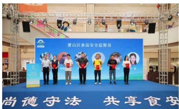
2025年杭州市食品安全宣传周启动仪式暨萧山区主场活动