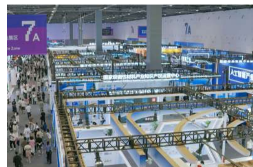
第三届专利密集型产品展览专区活动在萧山开幕

新成果加速涌现:有效发明专利拥有量达1.417万件,同比增长超25%;专利密集型产品备案702件,3项专利获中国专利奖,创历史新高;浙江省元宇宙产业专利导航服务基地等4个省级创新平台相继落地,国家知识产权局商标业务杭州受理窗口获评全国优秀,创新生态持续优化。更具里程碑意义的是,全国首单专利密集型产品知识产权证券化产品在深圳证券交易所成功发行,汇聚8家企业的32项高价值知识产权,评估价值达1.0798亿元,标志着“知产”变“资产”取得关键突破。