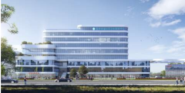
盈丰社区服务中心顺利封顶(预计2027年投用)

民生无小事,枝叶总关情。盈丰始终把群众的“急难愁盼”放在心上,扛在肩上,用一件件看得见、摸得着的实事,绘就民生幸福的温暖底色。 集体经济“稳中有进”,共富底气更足。主动对接世纪城管委会、区级留用地步谈,全面核实各经联社村留地开发情况,统筹协调化解历史遗留难题,实现村留地改革方案稳步落地。加速推进重点项目,盈一第六空间正式开工,利一海威国际按计划加快建设,利二EIC顺利建成交付,集体经济发展动能持续增强。启动4780亩东江围垦土地竖向抬升工程,显著增强土地市场价值和产出效益,为集体经济培育新的稳定增长点。2025年,街道经联社总收入超3亿元,同比增长6.7%,其中7个社区经联社集体存款排名全区前十,总存量近35亿元,位居全区第一。