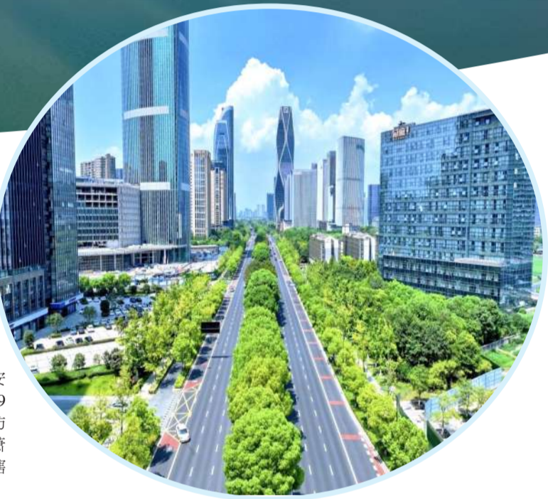
城市“颜值”不断提升

党建强则发展强,党建兴则事业兴。盈丰始终坚持以党建为引领,以组织力提升为核心,把党的政治优势、组织优势转化为发展优势、治理效能。 品牌创建“示范引领”,党建效能更优。归谷中心楼宇党建纳入全国“两个覆盖”集中攻坚首个工作片会观摩点,充分展示盈丰楼宇党建工作成效。丰北社区获评省红色根脉强基示范村社,成为基层党建工作的标杆典范。奔竞产业园社区纳入市级新兴领域党建现场会考察点,为全市新兴领域党建工作贡献了“盈丰经验”。这些荣誉的背后,是盈丰坚持党建引领、深耕细作的生动体现。 作风建设“常抓不懈”,政治生态更清。压紧压实领导干部“一岗双责”,将日常监督嵌入谈心谈话和“三重一大”事项决策全过程,推动廉洁履职常态化、长效化。全面落实党风廉政建设责任制,常态化开展廉政谈话。聚焦群众身边不正之风和腐败问题,深入开展整治乱占专项行动,加强监督检查与问题整改,重点推动解决经联社租金拖欠、收账难等历史遗留问题,基层政治生态不断净化优化。 服务效能“提质增效”,政务品质更高。深化“放管服”和政务服务增值化改革,全年高效办结政务服务事项3.8万件,办事满意度、实现率连续两年保持100%。提升街道法治惠民水平,盈丰公共法律服务站全年接待群众法律咨询254件,完成法律援助初审36件,有效满足群众法律服务需求。严把合法性审查关口,全年完成审查897件,切实筑牢依法决策防线。