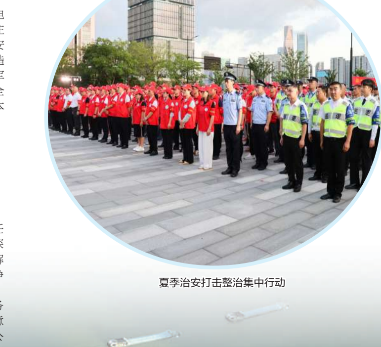
夏季治安打击整治集中行动