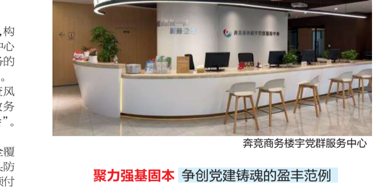
奔竞商务楼宇党群服务中心

聚力平安善治 争创和谐稳定的盈丰范例 矩阵式打造综治中心。加快“1+3+18”综治中心体系建设,构建分层过滤调解机制,确保群众诉求依法高效办结。做强街道中心指挥功能,突出3个分中心在楼宇治理、“赛会演”保障、商圈服务的专业支撑;完成18个社区工作站规范化建设,推动治理重心下移。 纵深式做强治理品牌。依托网格实体化运行,滚动排查风险,动态更新“三张清单”,推动矛盾纠纷早化解。优化“政务95110”响应机制,拓展AI社工服务场景,构建“新熟人社会”。做实“联接助企”,精准服务楼宇企业。 全链条确保社会平安。实现住宅及楼宇项目微型消防站全覆盖。全年开展不少于100场消防宣传教育和200场应急演练。源头防范矛盾纠纷,压降欠薪平台案件10%以上。聚焦房地产、金融、预付消费等重点领域风险,构建“监测—研判—交办—反馈”闭环。