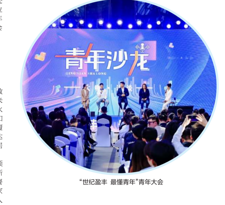
“世纪盈丰 最懂青年”青年大会