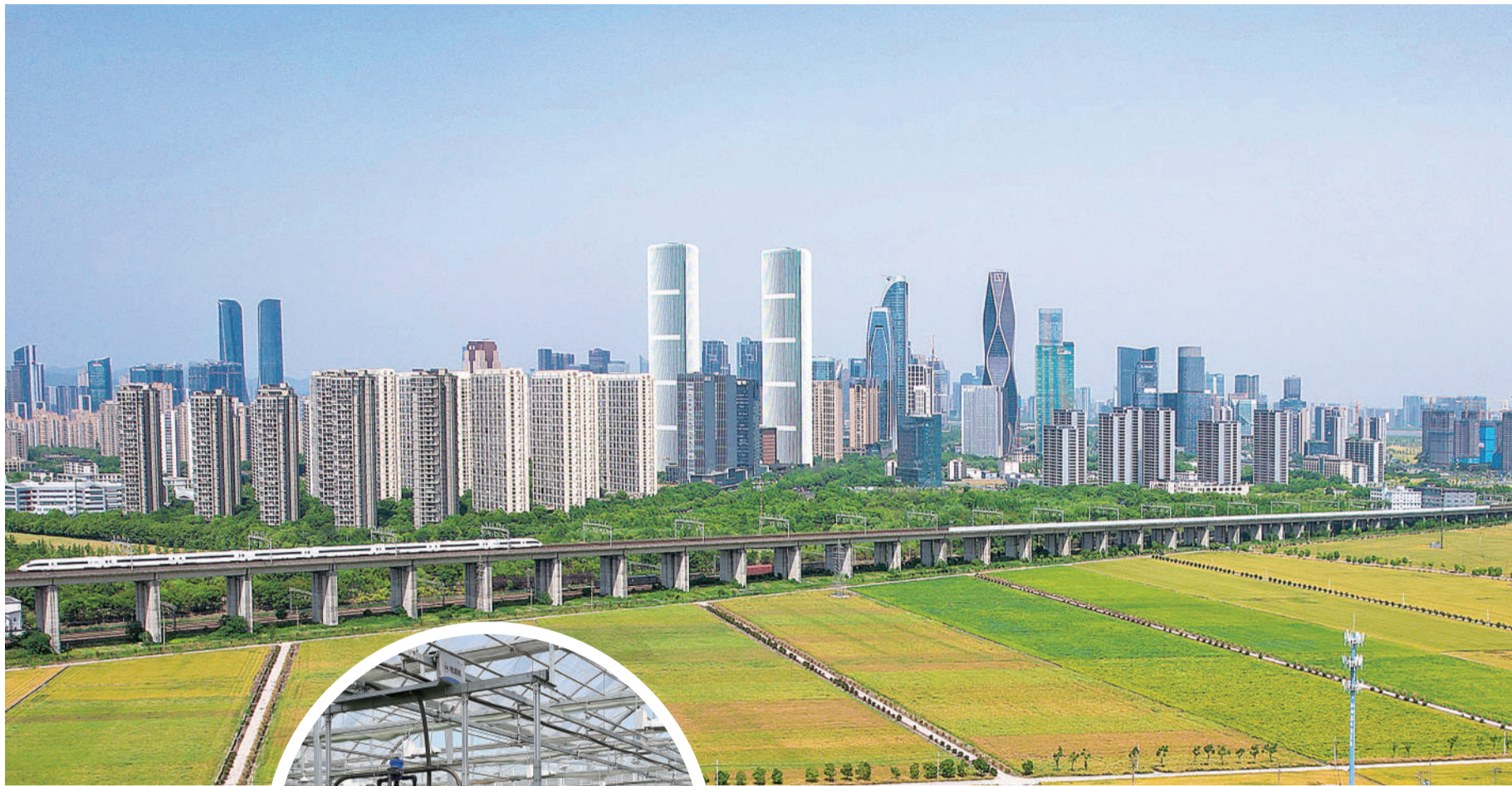
◀谢径安·传化农创村 ▲钱江世纪城

回望“十四五”,锚定高质量发展主线,萧山以时间为轴、实干作笔,在时代中奋力奔竞、在奔竞中聚力突围、在突围中全力争先,乘风破浪、行稳致远,全面擘画再展雄风、再创辉煌的精彩篇章。