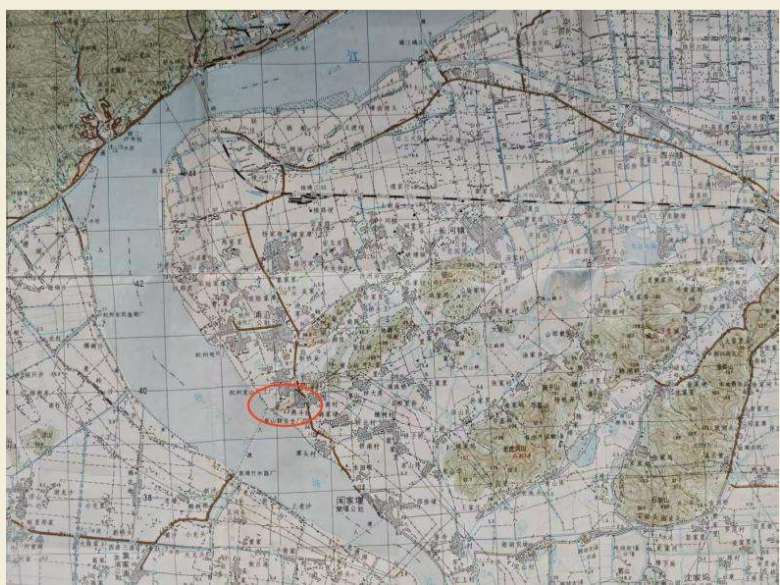
半月山地理位置(红圈所示)地形图