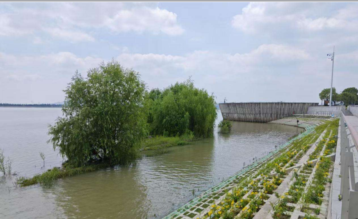
钱塘江中留存的半月山一角(闻堰地段)

现今江海塘分布,以半月山为分界处,上游小砾山至半月山段是(汉唐以来)钱塘江西江塘,麻溪至小砾山段是(明中后期)浦阳江西江塘,下游的(清末)南沙大堤和(当代)围垦标准堤塘,皆被认定为钱塘江海塘。为此,萧山江海塘划分,应以半月山为界,上游为江塘,下游为海塘,(汉唐以来)北海塘从半月山开始算起,回归原本,溯源历史,结合实际,符合现状。以西兴为界划分江海塘,疑似萧绍海塘近代史上的一处错误,应予纠正。